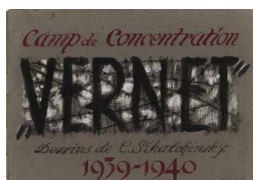
Dessin de Constantin Sikatchinsky- Collection camp de concentration du Vernet d'Ariège.